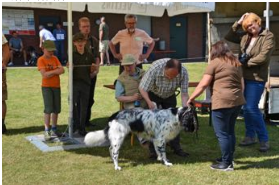
Die Richter geben sich alle Mühe