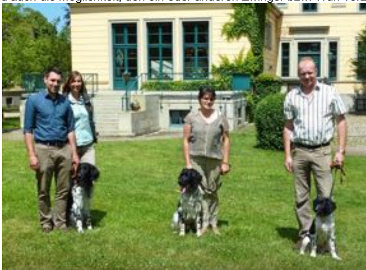
3 Generationen - Zwinger „von Kleinenkretzen“ – K-Wurf (v.l.n.r.):

Es bestand auch die Möglichkeit, den ein oder anderen Zwinger bzw. Wurf vorzustellen.