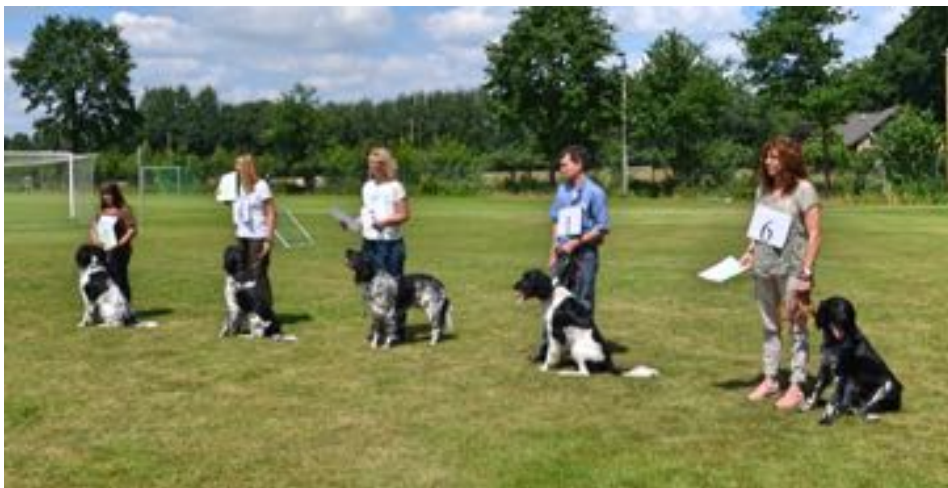
Die Rüden der Altersklasse