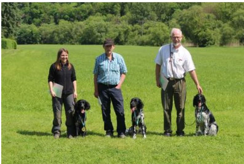
2 Die ersten drei Plätze der Hündinnen: