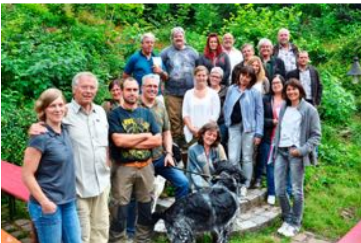
Teilnehmer des Epigenetik-Seminars

Die Epigenetik beschäftigt sich u.a. auch mit jenen vererbaren Unterschieden, die sich nicht auf die Veränderungen des Gencodes zurückführen lassen. Somit war auch sehr interessant zu erfahren, wie viel Einfluss der Mensch bei der Epigenetik des Hundes hat. Gute acht Stunden Konzentration