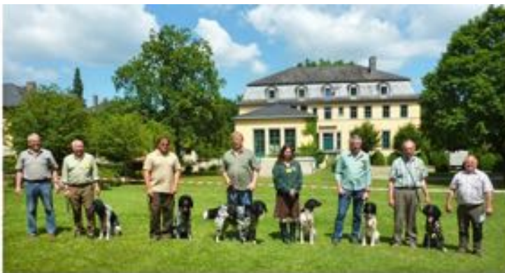
Handinnen und Huden – Jeweils Platzierung 1-9 (v.l.n.r.):