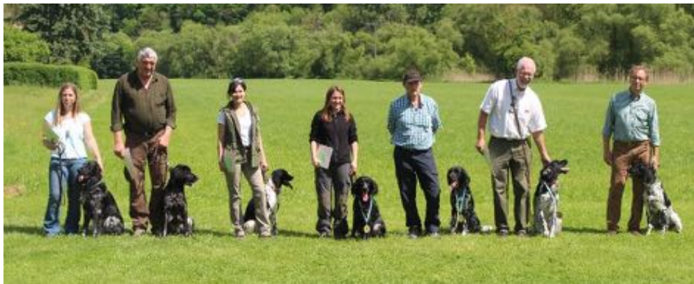
1 Die 7 vorgestellten Hündinnen mit ihren Führerinnen und Führern: