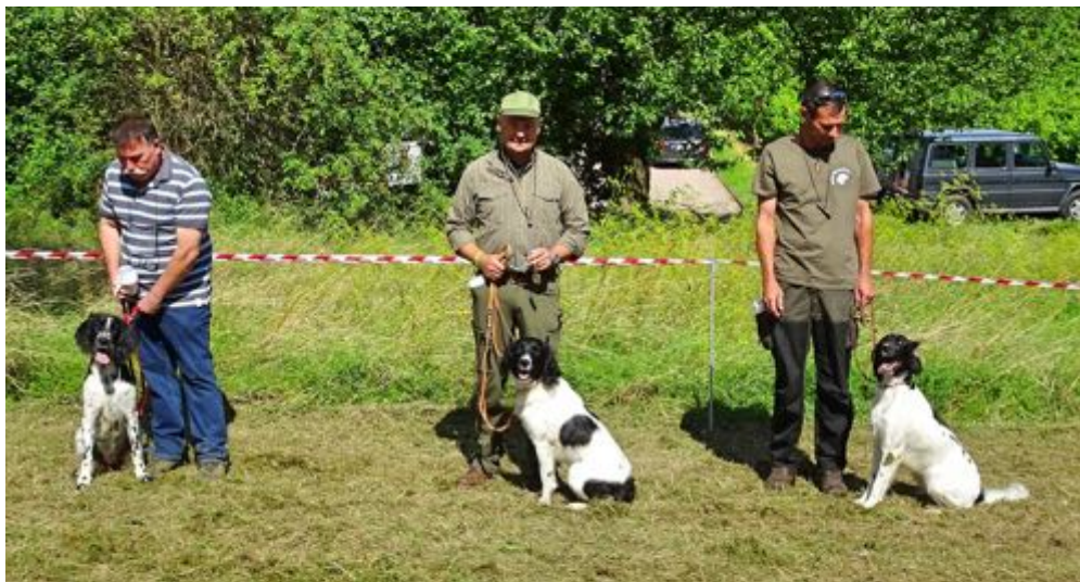
Diana vom Pfaffenbuck, Catarina von den Eisheiligen und Kaisa vom Donnersberg

Im Anschluss an die Zuchtschau folgte wie jedes Jahr unser Grillfest, bei dem den Hundeführern, Richtern und Zuschauern bei gutem Essen und Trinken wieder die Möglichkeit zu einem ausgiebigen Gespräch geboten wurde.