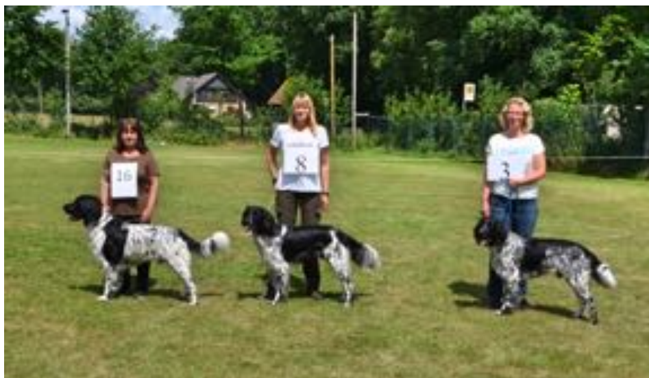
Die Erstplatzierten Rüden der Altersklasse

vl.: Billy vo Hundsfeld sg/v, Ferdi von Wessnedorf sg/v und Aiko vom Tiebensee sg/v Erstplatzierte Rüden