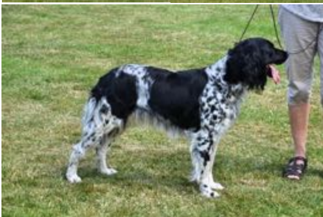
Hündinnen: Ciska vom Hundsfeld, Vranka II vom Bußhof, Senta van het Mekkenesch