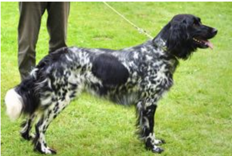
Babsi vom Treenetal(sg/v)

Rundum war es eine gelungene Veranstaltung mit guten Bewertungen der Großen Münsterländer.