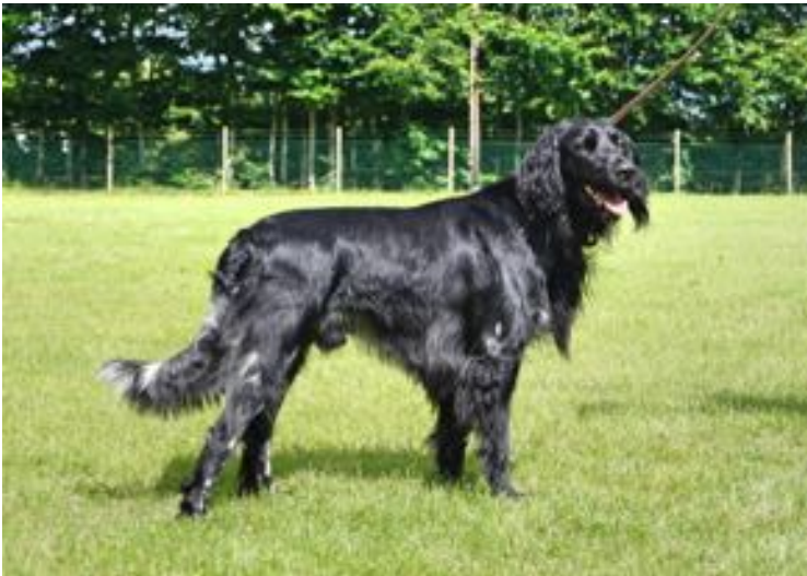
Adsche von Noorndörp(v/v)