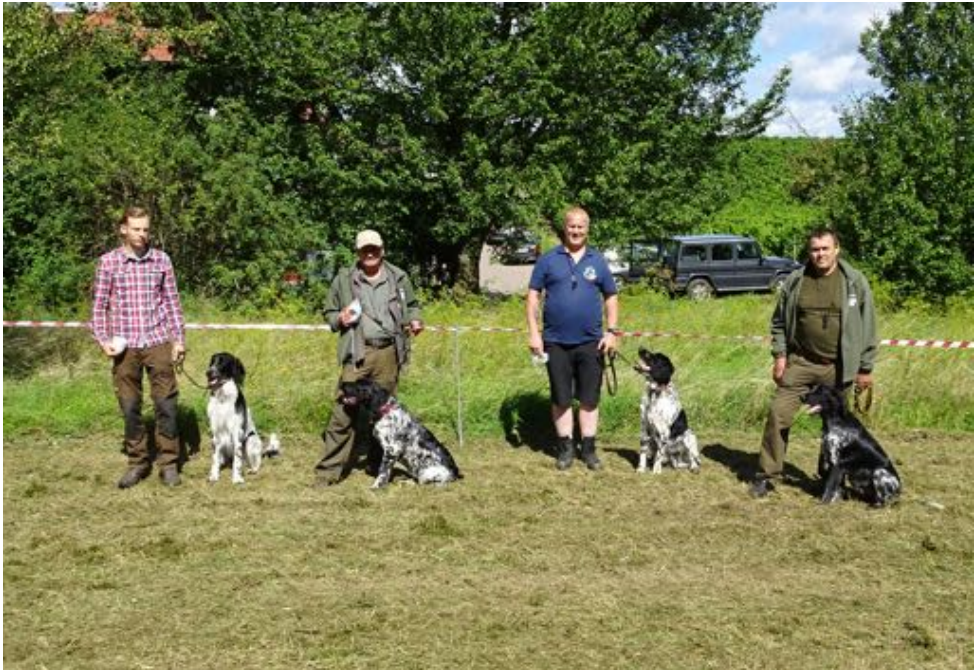
Kiro vom Donnersberg, Chester von der Kiwitzheide, Karlo vom Donnersberg und Bajan vom Stromberg

Die vorgestellten Hunde wurden anschließend im Ring getrennt nach Rüden und Hündinnen eingeordnet: Dabei blieb aufgrund der geringen Teilnehmerzahl die jeweilige Altersklasse unberücksichtigt. Die Bilder zeigen die Hunde in der Rangfolge von links nach rechts: